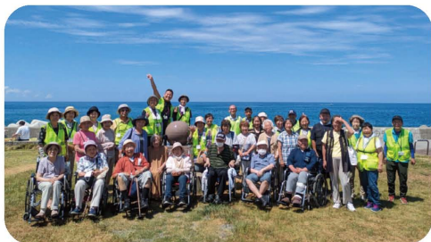
いきいき外出事業

社会福祉協議会の活動費として、地域福祉の推進に活用しています。「いつまでも安心して暮らしたい」こうした願いを叶えるために、一緒に地域づくりをしていきませんか。