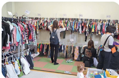
子ども服リユースの実施

高齢や障がいの方々との外出を、ボランティアの皆様にご協力いただき共に支え合う事業として実施しています。ボランティアさんも募集中です!