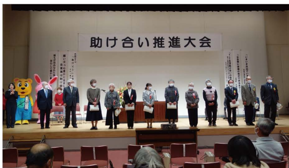
令和4年度の助け合い推進大会の様子