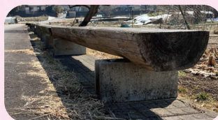
ベンチご利用下さい！