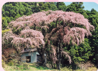
地域を見守る夫婦桜

日当たりの良い場所で、濃いピンクの花が咲きます。県内外のファンが多く、観桜祭はとても賑やかになるそうです。