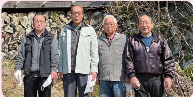
大日向町 桜の会の役員さん

4月、待ちにまった春です。春と言えば、桜。市内には、いくつもの桜の名所がありますね。今回は豊丘の大日向観音堂のしだれ桜と桜を守る「桜の会」をご紹介します。