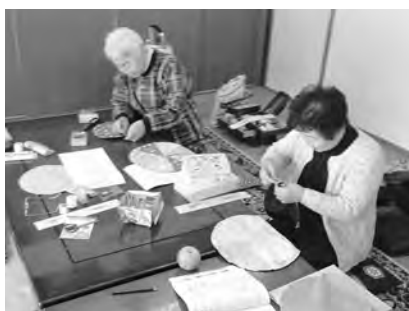
縫っている最中でもおしゃべりは止まりません!!

る方はお気軽におこしください。（開催日が休日・休館の場合がありますので、初めての参加希望の方はお問合せください。）