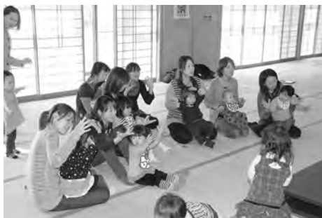
「グー・チョコ・パー」でなに作るう?? ~手遊びです~

■青年海外協力隊の方 にお話をお聞きしま した。クイズや民族 衣装の着付け体験、 楽しかったです。