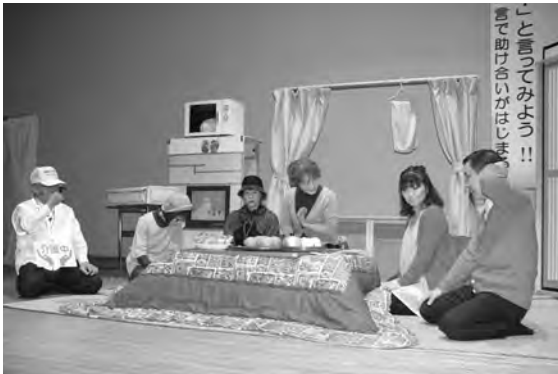
◀昨年度の助け合い推進大会の様子