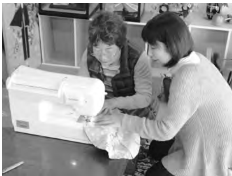
ミシンはゆっくり正確に!!

すざか助け合い推進センターでは、様々な行事や日々の活動をしています。その一部をご紹介します。今回は、パッチワークの教室です。