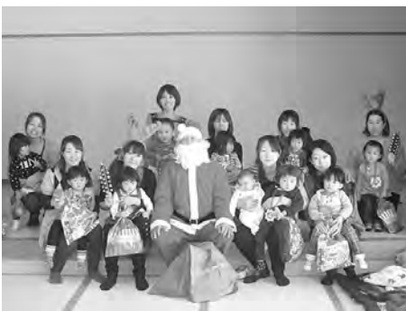
サンタさんと一緒に

しかし、花より団子、色 気より食気、もらったお菓 子を大事そうに抱えている 子や、美味しそうに食べて いる子がいたり、何時ま で見ても飽きない楽し い時間を過ごさせていた だきました。