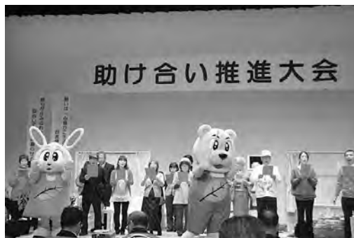
H24助け合い推進大会