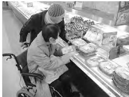
「こころつなぐ助け合い事業」でのお買い物のお手伝い。