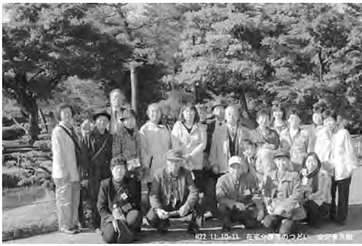
昨年は兼六園に行きました！

～昨年度参加者の声～ ・参加できて本当に良 かったです。また一 生懸命介護を頑張り たいと思います。