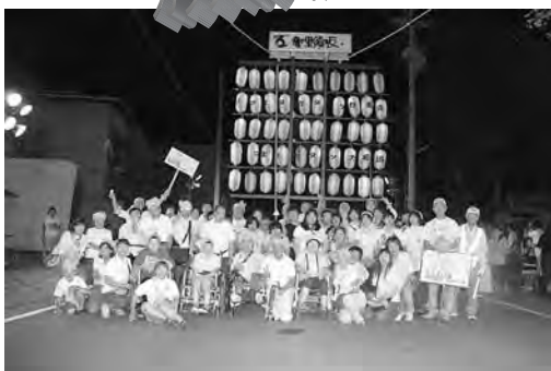
最後はみんなで記念撮影

また、障害のある子供さんが、自らすすんで整理員となり、連をしっかりとリードしてくれ、スムーズに進行できました。