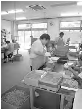
▶作業ボランティア