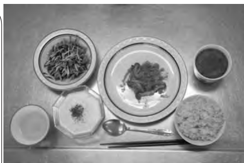
1回目の「カラフルな洋食」

普段なかなか外出が出来ない重度障がい者の方々とはボランティアとの協力・交流を通して、調理する楽しさや安全な調理方法を知っていただく機会になるよう3回シリーズで須坂市が主催している「障がい者生活訓練講座」(身体・知的・精神の障がいのある方)と合同で開催をしました。