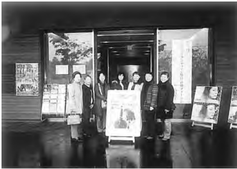
「軽井沢大賀ホール前にて」

夜は「夕食情報交換会」が軽井沢プリンスホテルのメインバンケットホールにて行われ、各地域の方々と交流することもできました。その中で、「地域通貨を使用した支え合い」の仕組みを教えてくださいましたが、須坂でも似たような支え合い「くまのなぐ助け合い」事業があることも伝えました。