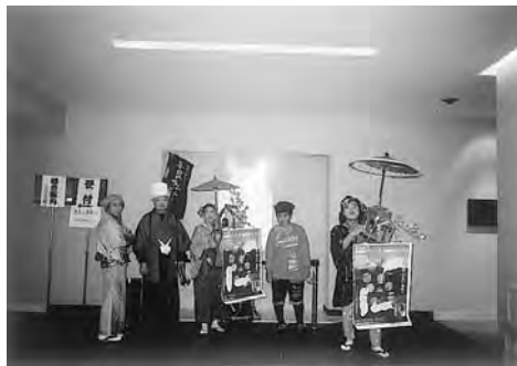
実行委員のみなさんによる「チンドン屋」