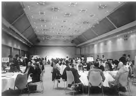
プリンスホテルで行われた「夕食・交流会」

・自分達のふるさとの美しさと魅力を次世代へ受け継ぐために何をすべきかを共に考え、それを活かしたまちづくりの実践と、住民自治意識の向上をめざし地域の人々との交流を行うことが大切である。等、様々な意見について話し合いが行われ充実した分科会でした。