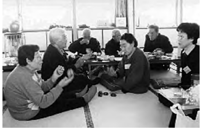
だれでも受入れる楽しい集まり ・ふれあいサロン