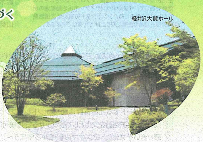
軽井沢大賀ホール

「ボランティア全国フォーラム軽井沢2018」では、 この思いを参加者のみなさんと共有し、ともに 考え、全国に発信していきます。 みなさんの参加をお待ちしています!