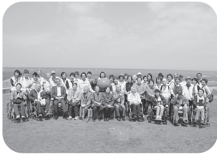
海をバックに全員でハイ!チーズ!!