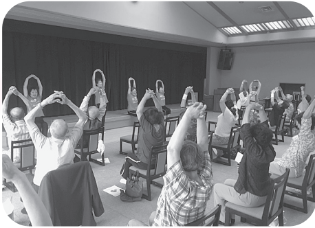
須坂エクササイズ♪